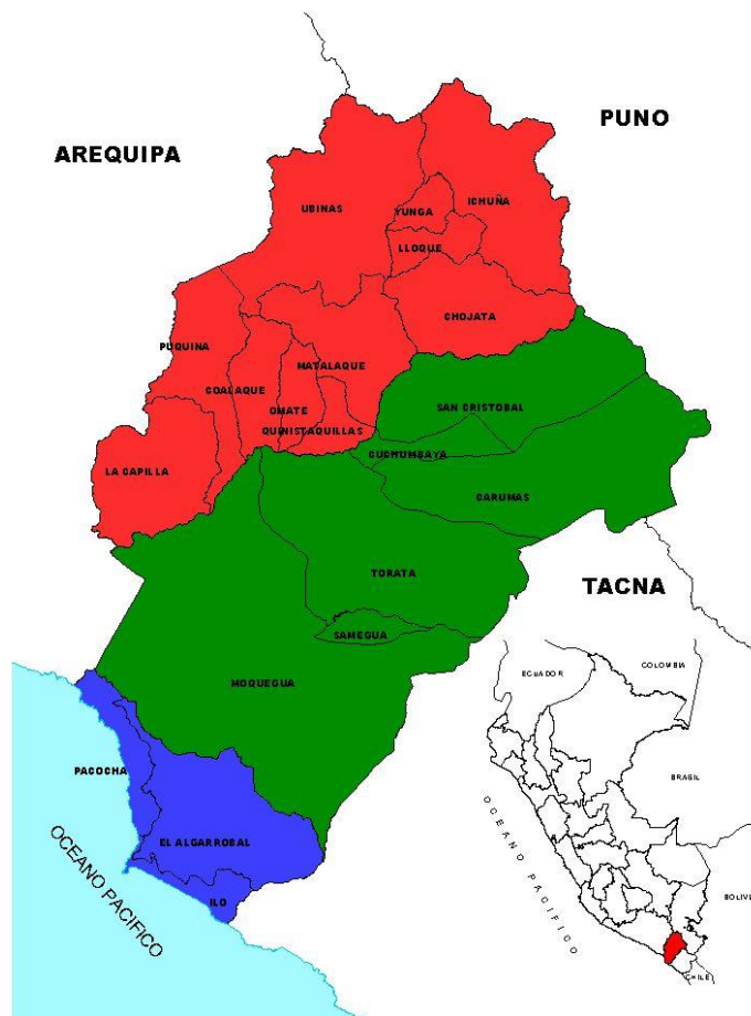
Gráfico N° 01.- Ubicación Geográfica de la Región Moquegua

La Región de Moquegua abarca un territorio de 17,574.82 km 2 , que equivale al 1.37% del territorio nacional y está integrado por 03 provincias, un total de 20 distritos y 24 centros poblados.